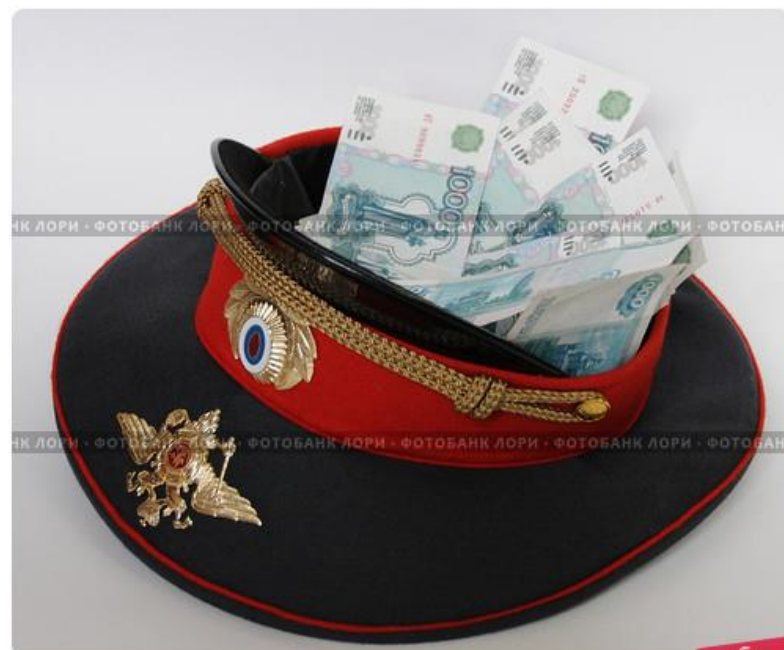
Деньги в фуражке